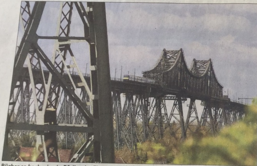
Bücher so hoch wie ein Pfeiler der Eisernen Lady – die wollen die Schüler lesen.